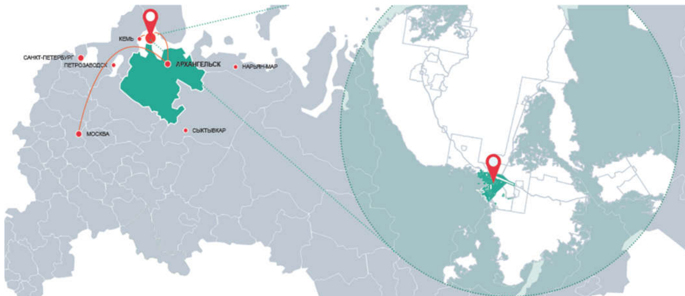
Рис. 1. Схема расположения поселка Соловецкого

Разработка архитектурной концепции трёх жилых блоков из двухэтажных жилых зданий и хозяйственных строений в составе программы «Строительство многоквартирного жилого фонда для расселения из ветхого и аварийного жилого фонда пос. Соловецкий, включая расселение из монастырских памятников истории и культуры. 1 этап»